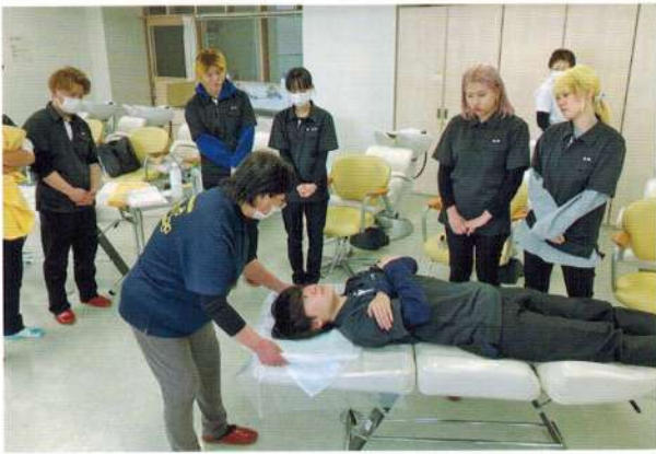
Matsumoto Barber and Beauty College