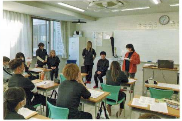
Matsumoto Barber and Beauty College

自分の身近にも車いすを使っている人がいるので、今回の講習会を受けさせて頂いて考え方が変わりました。日常で車いすを使っている人がいて、もしもその人や周りの人が間違った使い方をしていたら注意して安全な車いすライフを送ってほしいです。