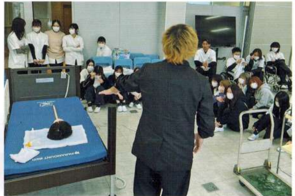
Shizuoka Prefectural Beauty College