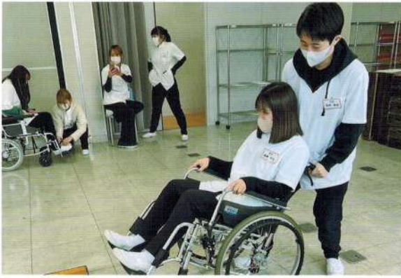
Shizuoka Prefectural Beauty College