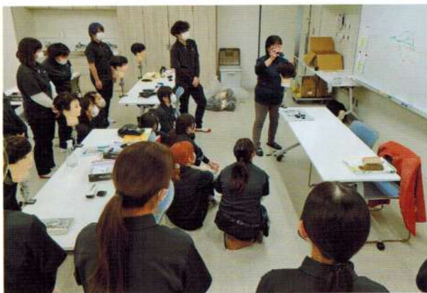
Nagano Barber and Beauty College