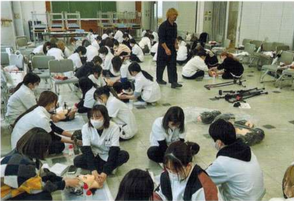
Shizuoka Prefectural Beauty College