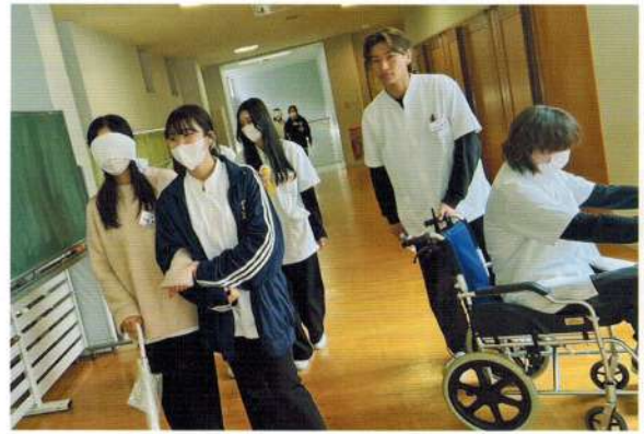
Shizuoka Prefectural Beauty College

普段学ぶことのないようなボディメカニクスや体の重心の話などを聴くだけではなく体験することが出来勉強になった。視覚障害の方のサポート方法、車椅子のおし方使い方など！年生の時に学んでいたけど忘れていた事を再認識覚えることが出来た。これから訪問理美容をする事があってもなくても日常生活で生かせそうな事が多くあった。