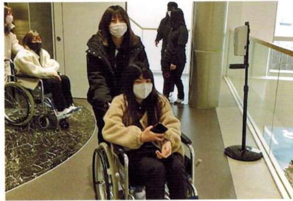
Nagano Barber and Beauty College

学校に入学する前から福祉美容に興味があり、資格を取得したいと考えておりました。今日、初めてバリカンを使ってのカットや、コームを使って段差をほかす技術などを教えて頂き、自分の技術として身に付けていきたいと思います。高齢化が進んでいる社会で必要な福祉理美容士に一步近づき講習会を受けることができて、とても良かったです。改めて美容師は相手の喜びを与えることができる存在であることを実感し、目標をもっていきたいと思います。